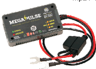
Mp2 / VEE