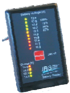
IBS-SBS & IBS-SBS/24V

Hochintegriertes leistungsfähiges Doppelbatterie-Relay für einachste Montage im Motorraum, nur 3 Anschlüsse benötigt. Relay ist mit 2 Status LEDs ausgerüstet für Relay- und Batteriezustand. Optionale Linkfunktion für 30 Min. Kann mit Taster aktiviert werden. Anhängerbatterie Erkennungsfunktion schaltet Leistung zum Stecker ab, wenn kein Anhänger vorhanden ist. Ermöglicht den Aufbau von 3fach Batteriesystemen mit IBS-DBS und DBi-DBS.