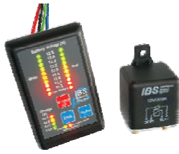
IBS-DBS & IBS-DBS/24V

Intelligent Battery System IBS the ultimate Battery System