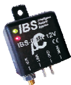
IBS-DBR & IBS-DBR/24V

Der Batteriemonitor für Montage im Armaturenbrett gibt Auskunft über den Linkstatus vom IBS Relay. Zusätzlich werden Alarme (blinkende LED und Buzzer) für Tiefentladung beider Batterien und Linkfehler angezeigt. Ein manueller Link für 30 Min ist verfügbar.