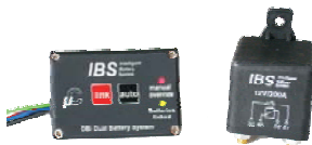
DBi-DBS & DBi-DBS/24V

Die IBS Doppelbatterie Systeme trennen die Starter Batterie von der Bordbatterie wenn das Fahrzeug steht und verbindet diese, wenn das Fahrzeug fährt. In Notsituationen kann über die manuelle Link-Funktion ein Start ab Bordbatterie durchgeführt werden. Alle Systeme sind mit dem IBS 200A Leistungsrelais ausgerüstet. Die Linkfunktion unterstützt den Einsatz el. Bergewinden oder Wechselrichter mit hohem Energiebedarf. DBi-DBS und IBS-DBS werden mit einem 4.7m Installationskabelsatz mit wasserdichtem Automotiven Stecker für einfache Installation sowie Batterie- und Crimpterminals geliefert. Alle Systeme sind in 24V erhältlich. Eine D+ Leitung wird nicht benötigt.